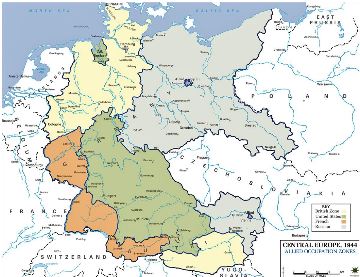
Die Besatzungszonen 1945 ⇩