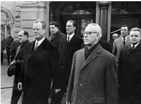
Erfurter Gipfeltreffen 1970, erstes Treffen von Willy Brandt und Willi Stoph, dem Vorsitzenden des DDR-Ministerrats

Der Grenzübergang Bornholmer Straße am Vormittag nach der Maueröffnung am 10. November 1989 ⇐